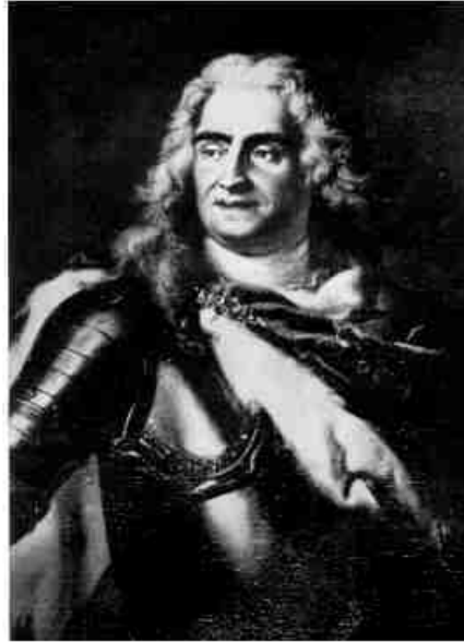
August II Tugev