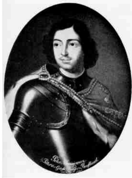
Peeter I Suur