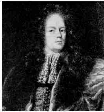
Jacob Johann Hastfer

Patkuli elus hakkas nüüd domineerima armastusest palju võimsam kirk – poliitika. Asi sai alguse nn reduktsioonist ehk mõisate tagasivõtmisest Rootsi riigile. Riik oli vaesustunud pikkade sõdade tagajärjel ja mitte viimasel kohal polnud siin mõisate jagamine teenekatele ametnikele ja sõjaväelastele. Eriti oli sellise jagamisega silma paistnud Gustav Adolphi tütar Christine. Aadelkond oli mõisasid saanud Rootsis, Liivimaal, Ingerimaal ja Pommeris ja riigi maavaldused olid väga väikeseks kahanenud. Raha oli riigil veelgi vähem. Nii võttiski kuningas Karl XI ette mõisate taasriigistamise, mida juba Gustav Adolf oli ette valimistanud. Kuid Rootsi riigipäeval polnud tegelikult õigust Liivimaa privileegide tõttu Liivimaa kohta käivaid seadusi vastu võtta, sest see oli ainult Liivimaa maapäeva õigus. Ja juba Gustav Adolfist alates oli iga kuningas töötanud Liivimaa õigusi mitte rikkuda. Seda oli teinud ka Karl XI Ljungbys 10. mail 1678.aastal, kuid klausliga, et see töötus ei tohi kuningale ja riigile kahju teha (sellest klauslist saksa autorid juttu ei tee!). Ja nüüd kuniinga arvates kahju sellest sündis. Reduktsioon toimus mitte ainult vahepeal rootslastele antud mõisates, vaid ka balti aadli pärusmõisates. Kuigi kindralkuberner oli Eestimaa mees, osutus ta kuningale truuks sulaseks ja töötas kuninga kasuks raudse järjekindlusega. Rüütelkonnal polnud temast mingit tuge. Nii