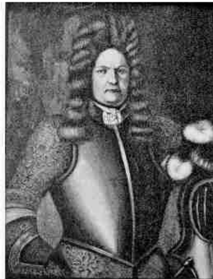
Johann Reinhold Patkul

Patkulile üle andma, sellega tekkis muidugi suuri pahandusi, nii et ta oma onu Vietinghoffi lausa duellile kutsus! Kuna see sündis maapäeval Riias, seega avalikus kohas, siis sai Patkul kindralkubernerilt trahvi kaela. Vendade ja õdedega tehti leping, õed said kumbki pandiks mõisa, hilisemaks tasaarvelduseks. Vennad pidid saama suure summa, kuid ositi. Noorema venna Jürgeniga polnud tal probleemi - see läks sõjaväkke ja langes varsti duellil Hamburgis. Karliga polnud asi nii lihtne, sest ta oli oma ema poeg. Karli naine ja äi veensid teda, et Patkul on teda alt vedanud. Vennad läksid kohe nagu kuked kaklema, järgnesid tülid ja protsessid. Aastaid hiljem toob see tülitsemine veel vastiku poliitilise järelmängu kaasa.